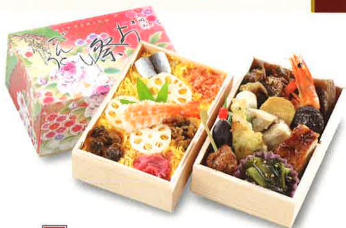
03 お祭り弁当 祭ずしとおかずを組み合わせた二段重の決定版 1,150円(税込) 16.0×10.7 cm×2段