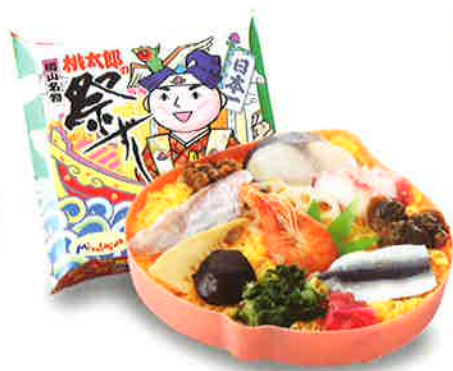
05 桃太郎の祭ずし 岡山が生んだ自慢のちらしずし！ 1,000円(税込) 19.0×19.0 cm