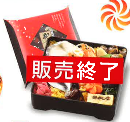
06 祭ずし「匠」 たくみ 伝統と郷土の味にこだわり上質な素材を詰込んだ「祭ずし」 1,300円(税込) 14.7×14.7 cm