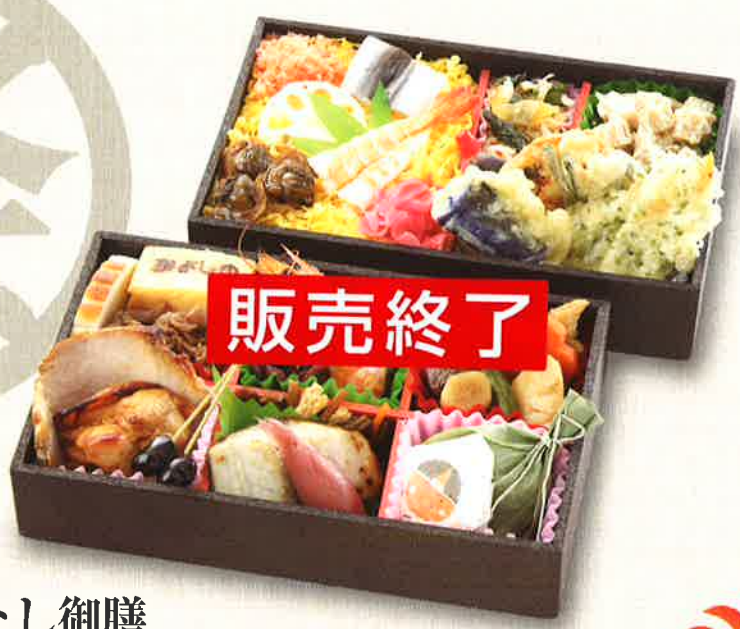
01 岡山おもてなし御膳 こだわりの素材を上品に詰め合わせた二段重 1,850円(税込) 12.0×19.8 cm×2段