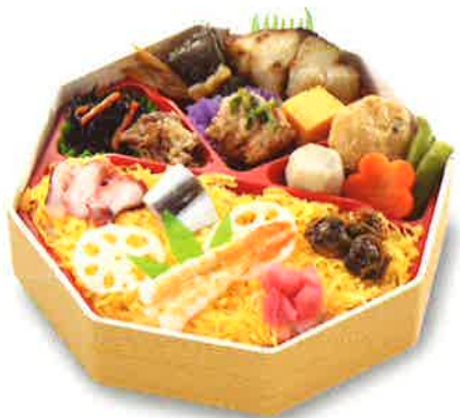
02 八角祭弁当 岡山名物「祭ずし」と多彩なおかずを詰め込みました。 930円(税込) 20.0×20.0 cm