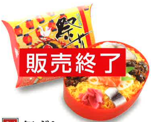
04 祭ずし かわいい小判型の容器に「祭ずし」が詰まった一品 830円(税込) 15.5×19.5 cm